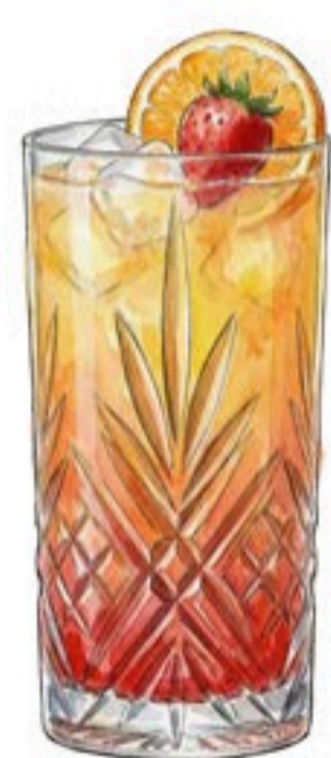
BORA BORA JUS D'ANANAS – JUS DE FRUIT DE LA PASSION – SIROP DE GRENADINE – JUS DE CITRON