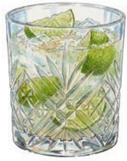
CAIPIRINHA CACHAÇA 6CL – CITRON VERT – CASSONADE