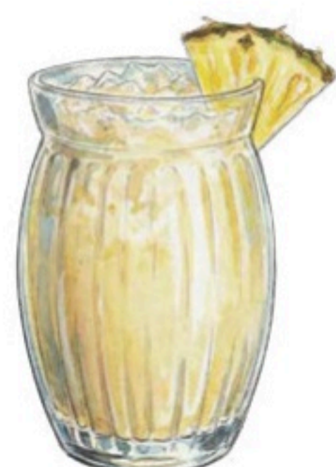
VIRGIN PINA COLADA JUS D'ANANAS – CRÈME DE COCO