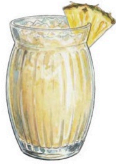
PINA COLADA RHUM 4CL – CRÈME DE COCO – JUS D'ANANAS