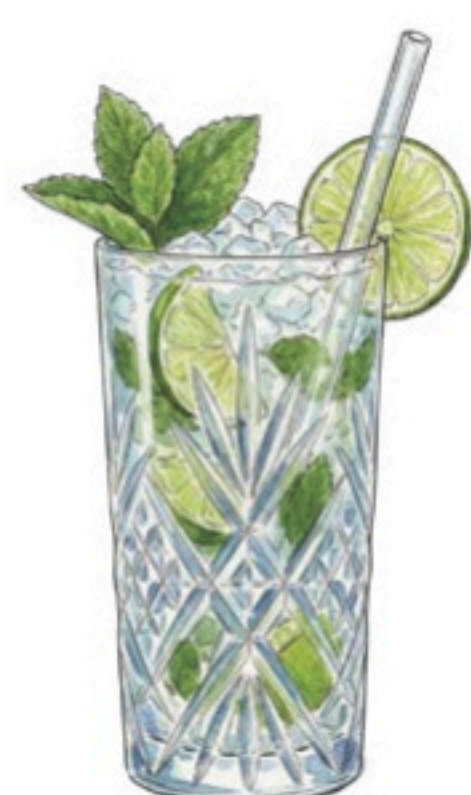
VIRGIN MOJITO SUCRE DE CANNE – MENTHE – PERRIER- CITRON VERT