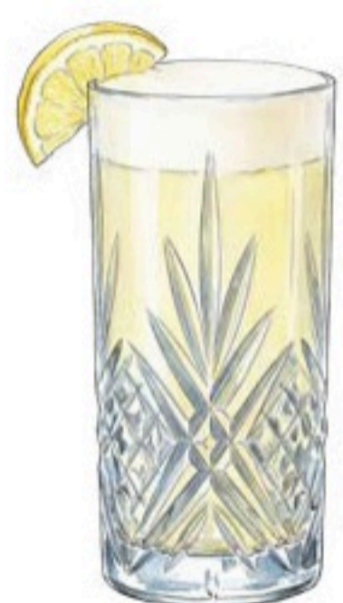
GIN FIZZ GIN HENDRICK'S 4CL – JUS DE CITRON – PERRIER – BLANC D'ŒUF